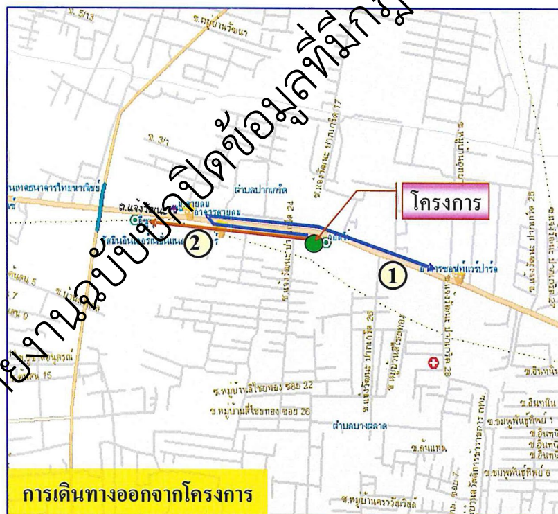
รูปที่ 1-2 เส้นทางคมนาคมเข้า-ออกโครงการ